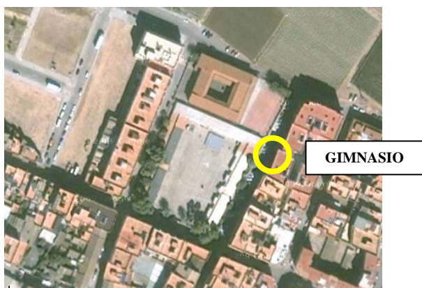
Figura 2. Vista aérea del colegio Mediterrani y la situación del gimnasio escolar.

Al norte de Meliana se encuentra el colegio público Mediterrani. Esta escuela ofrece la educación de los ciclos infantil y primaria, y fue la primera escuela de la comarca en ofrecer la enseñanza en lengua valenciana hace 25 años. Se compone de dos unidades claramente diferenciadas. Por una parte, el edificio escolar de dos plantas y un patio exterior que posee una extensión algo superior a un campo de fútbol sala. Por otra, el antiguo instituto Pío XII, en el costado sur. Este edificio actualmente alberga la Escuela de Adultos, aulas deterioradas por su desuso, el aula extraescolar de psicomotricidad y, utilizados por el Mediterrani, el patio y el antiguo gimnasio.