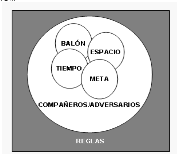
Figura 1. Elementos configuradores de la lógica interna en deportes de equipo de espacio común y participación simultánea. (LAGO, 2003 citado por MARTÍN y LAGO 2005, pp.103)

También con carácter sistémico, López Graña (2006) siguiendo a Lago (2000) para su análisis funcional del balonmano parte de sus componentes estructurales: reglamento, el espacio, el tiempo, la meta, el móvil, compañeros y adversarios. Estos elementos “interaccionan en el juego dando lugar, mediante las consecuencias funcionales que de ellos emanan, a la lógica interna de nuestro deporte” (López Graña, 2006, pp. 24).