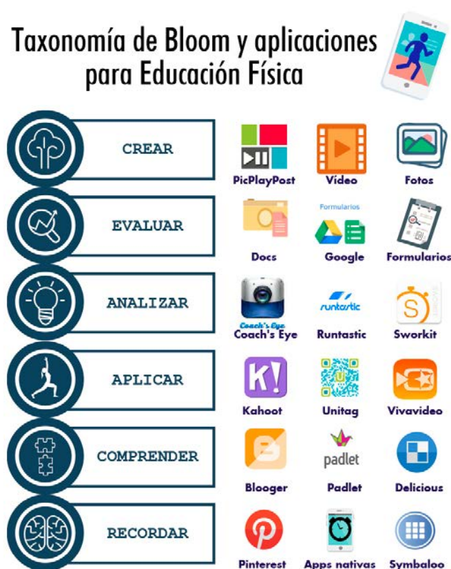
Ilustración 3. Taxonomía de Bloom adaptada por Churches (2009) y aplicada al uso del móvil en Educación Física.

En cualquier caso, entre los aspectos a tener en cuenta coincidiendo con Capllonch (2005) y Ferreres (2011), por un lado compartimos la idea de que la Educación Física es capaz de emplear las TIC para transmitir los contenidos de la asignatura de una manera más eficiente que con los métodos didácticos tradicionales, aunque por otro lado en alguna ocasión se plantee "que en la EF, la aplicación de las TIC entra en conflicto con las finalidades motrices y vivenciales del área" (Ferreres, 2011 p. 6).