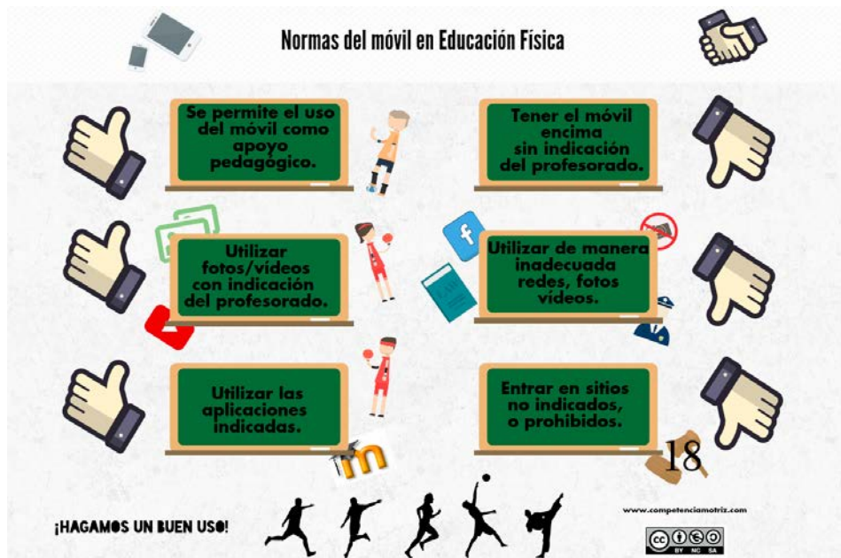
Ilustración 1. Normas de utilización del teléfono móvil en Educación Física dirigido al alumnado (Elaboración propia).

En consonancia con las opiniones de Capllonch (2005), no debemos olvidar que las TIC no pueden ni deben sustituir a la actividad motriz. Debemos plantearlas no como un reto sino como una posibilidad de ganar horas para la materia, han de ser incorporadas con la reflexión adecuada y evitando la improvisación.