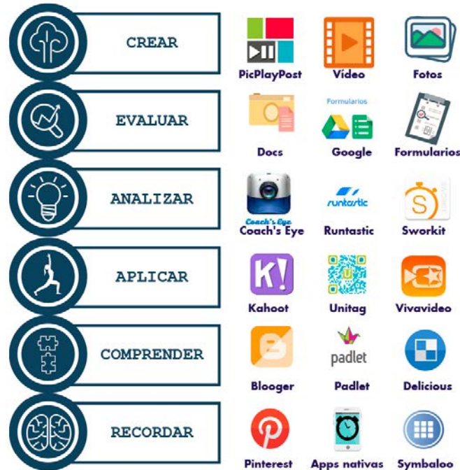
Ilustración 3. Taxonomía de Bloom adaptada por Churches (2009) y aplicada al uso del móvil en Educación Física.

En cualquier caso, entre los aspectos a tener en cuenta coincidiendo con Capllonch (2005) y Ferreres (2011), por un lado compartimos la idea de que la Educación Física es capaz de emplear las TIC para transmitir los contenidos de la asignatura de una manera más eficiente que con los métodos didácticos tradicionales, aunque por otro lado en alguna ocasión se plantee "que en la EF, la aplicación de las TIC entra en conflicto con las finalidades motrices y vivenciales del área" (Ferreres, 2011 p. 6).