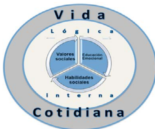
Figura 1. Relaciones de los elementos de la competencia social dentro del programa

No obstante, no todo acaba en esta idea. El profesorado de Educación Física que quiera sacar el máximo partido a su intervención pedagógica se encuentra con la piedra angular en torno a la cual debe girar todo el trabajo. Es el concepto de lógica interna. La lógica interna de una práctica aglutina todos aquellos aspectos que nos iluminan en la forma de actuar. Dice lo que se puede y lo que no se puede hacer, las metas a alcanzar, los elementos a evitar, las consecuencias de nuestros actos. En definitiva, viene a ser como el plano de una casa que, correctamente interpretado, puede dar una idea muy aproximada de su resultado real. Por esta razón, se erige en el elemento vertebrador de la intervención docente, dado que permite orientar las situaciones pedagógicas que se diseñen en la dirección deseada. En esta línea se manifiesta Lagardera (2007:69) cuando dice que "... permite al especialista diseñar y programar los ejercicios didácticos sabiendo de antemano, de modo teórico, las consecuencias que éstos van a desencadenar en los comportamientos motores de los participantes."